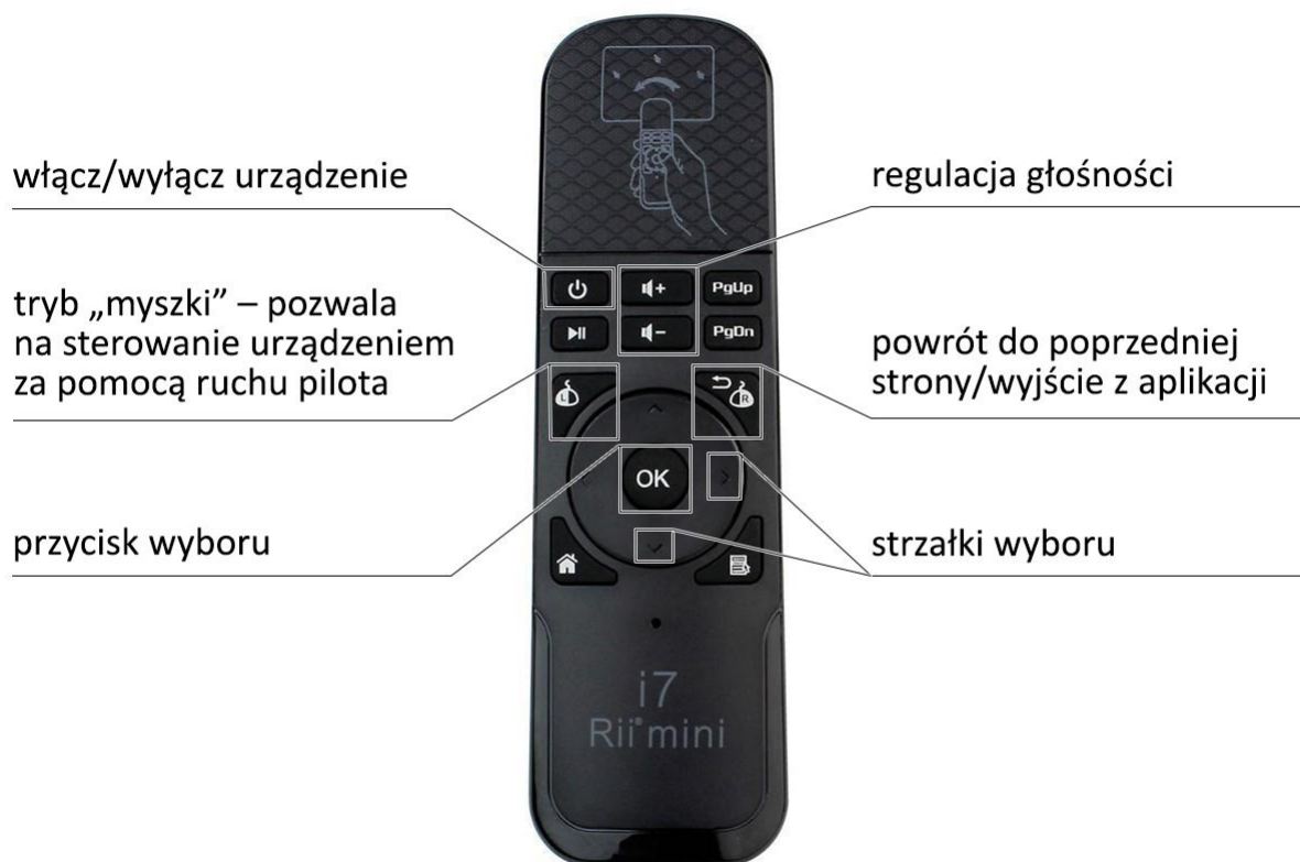
Zdj. 1 Pilot Rii mini i7

Przed przystąpieniem do korzystania z podłogi interaktywnej, należy sprawdzić baterie oraz nadajnik pilota, który powinienem być wpięty do portu USB w urządzeniu. Nadajnik znajduje się pod klapką baterii wewnątrz pilota.