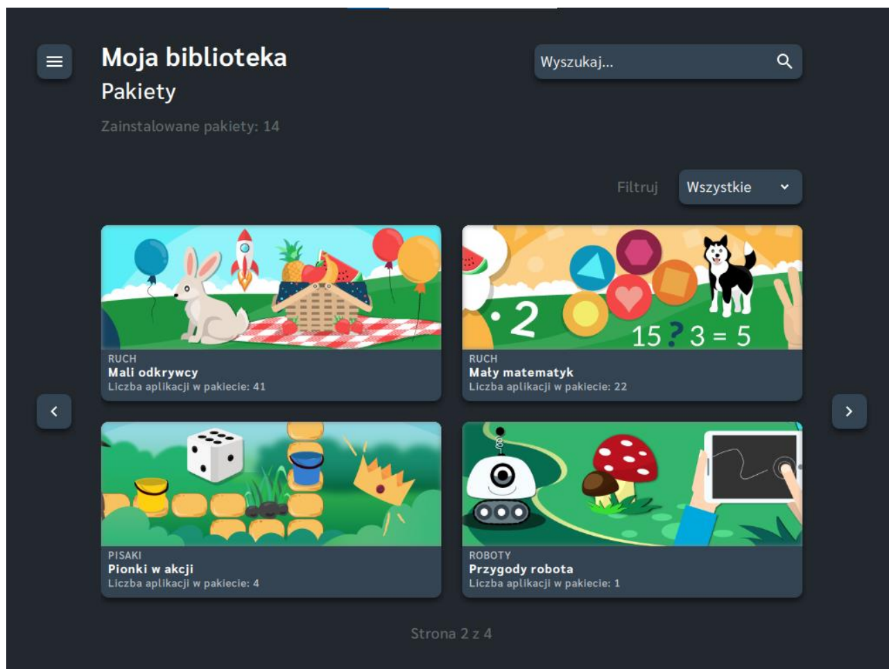
Zdj. 2 Ekran startowy

Po włączeniu urządzenia wyświetli się ekran startowy urządzenia (zdj. 2):